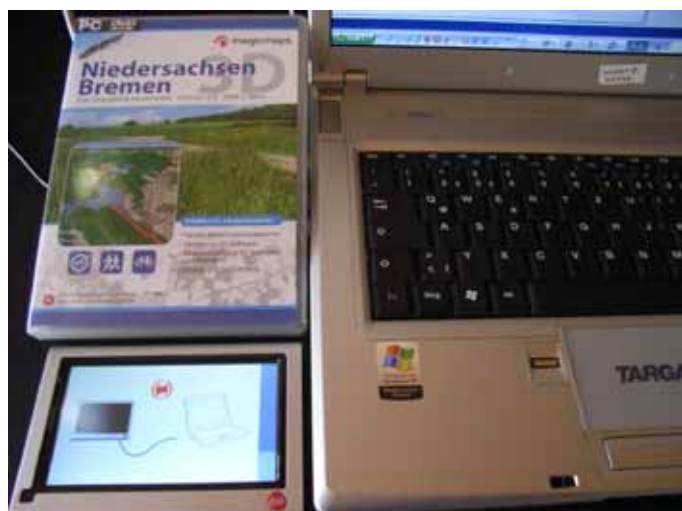
Ein Trio für die Tourenplanung: Die Kartensoftware von MagicMaps und das Navigationsgerät neben dem Notebook.

Nun soll ich im fünften Schritt noch die Software „Scout“ auf meinem PC installieren. Aus dem