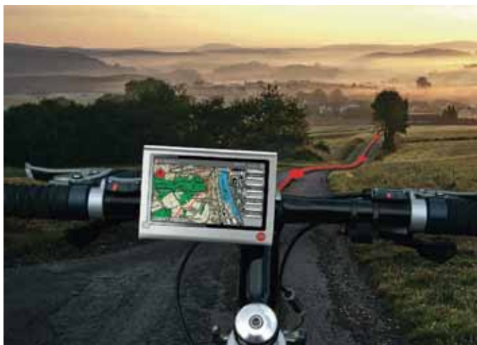
Das Navigationsgerät hilft einem nicht nur, den richtigen Weg zu finden, es zeichnet auch die gefahrene Route auf.